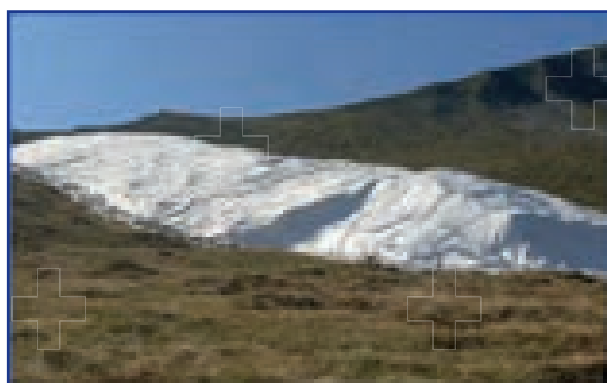
Schneedepot 30'000 m 3 auf 1700 m ü. M.