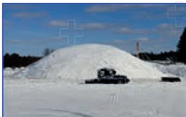
Schneedepot 35'000 m 3 für Langlaufzentrum Santa Sport Rovaniemi (Polarkreis)