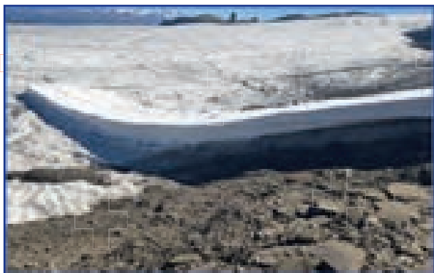
Grossflächiger Gletscherschutz auf 3000 m ü. M.